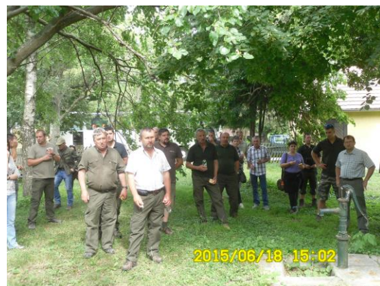
Gemenci HCS a Hanságban