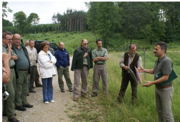
Tanulmányút az Órségben

2008. jún. 6-7. Szombathelyi Eg. Zrt., Órség