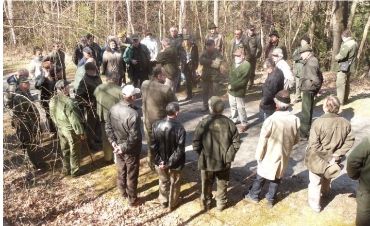
Tanulmányút a Soproni-hegységben