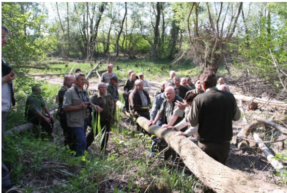
Nyugdíjasok kirándulása a Szigetközben

Aktívan részt vesznek tagtársaink a szakosztályok munkájában, az évenként megrendezésre kerülő egyesületi vándorgyűléseken és egyéb országos rendezvényeken. Külön figyelmet fordítunk a nyugdíjasok sorsának figyelemmel kísérésére, a segélyezések szervezésére.