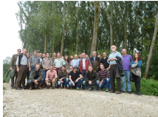
Karintiai kollégák a Szigetközben

2015. Tübingiai államerdészek Kapuváron és Ravazdon, Gemenc Zrt. csapata Ravazdon, Kapuváron, Győrben, Zalaerdő Zrt. csapata Göbös-majorban