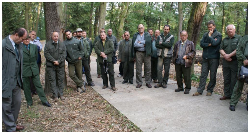
Tanulmányút a Dél-Alföldön