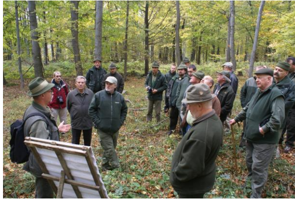
Tanulmányút a Börzsönyben

2008. jún. 6-7. Szombathelyi Eg. Zrt., Órség