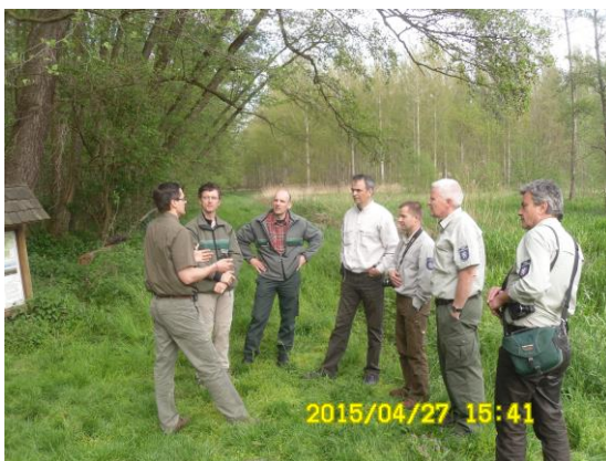
Tübingiai erdészek a Hanságban

2015. Tübingiai államerdészek Kapuváron és Ravazdon, Gemenc Zrt. csapata Ravazdon, Kapuváron, Győrben, Zalaerdő Zrt. csapata Göbös-majorban