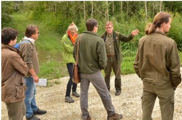
Sajtókirándulás a Kisalföldön

2014. Sajtókirándulás a Sokorói-dombságon és a Szigetközben, karintiai erdészek a Sokorói-dombságon és a Szigetközben