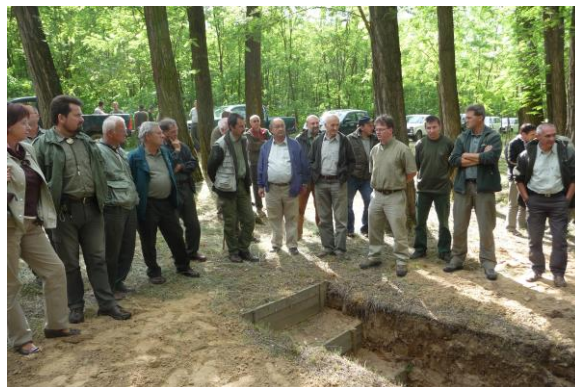
Tanulmányút a Nyírségben

2009. jún. 4-6. Nyírerdő Zrt., Nyírség-Debrecen