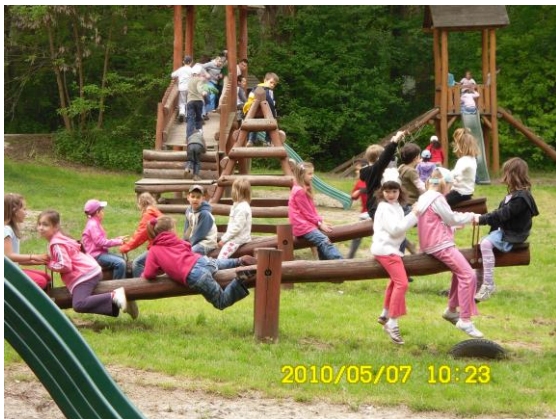
Madarak és Fák Napja a Püspökerdőben

- Minden évben részt veszünk a „Madarak és Fák Napja” és az „Erdők Hete” helyi rendezvényeinek megszervezésében, valamint az erdei iskolák munkájának segítésében.