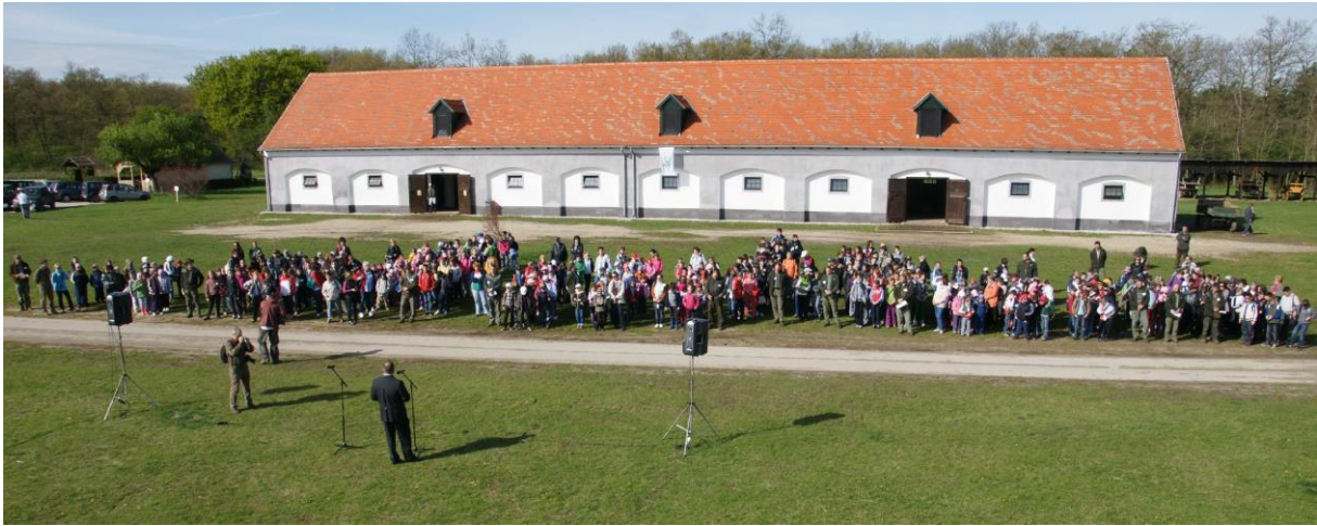
Föld Napja Göbös-majorban

2012. április 23.: Föld Napja rendezvény Göbösön (17 osztály, 440 gyerek)