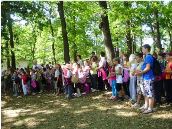
Madarak és Fák Napja Ravazdon

Fák Napja, Erdők Hete, Gyórkőcfesztivál, adventi erdei iskolai programok a bevásárlóközpontban).