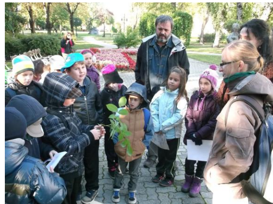
Erdők heti vetélkedő Győr parkjaiban