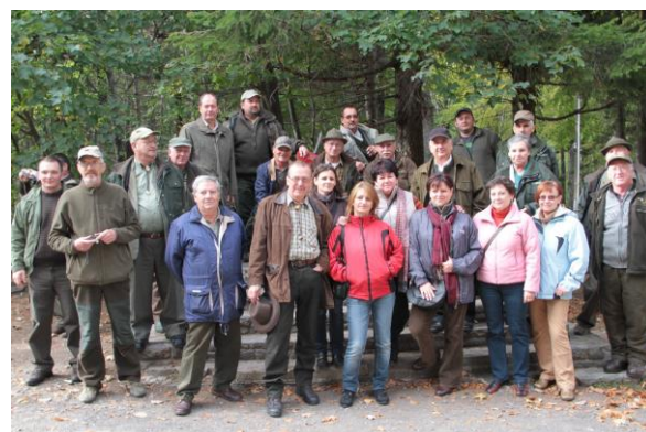
Tanulmányút a Mátrában

2012. okt. 12-13. Egererdő Zrt, Mátrafüred, Gyöngyös