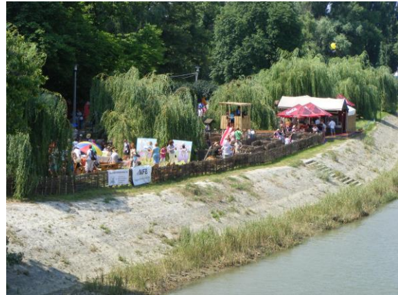
A Gyórkőcfesztivál erdész „részlege”

Aktívan részt vesznek tagtársaink a szakosztályok munkájában, az évenként megrendezésre kerülő egyesületi vándorgyűléseken és egyéb országos rendezvényeken. Külön figyelmet fordítunk a nyugdíjasok sorsának figyelemmel kísérésére, a segélyezések szervezésére.