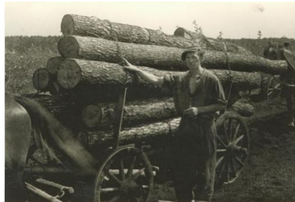
Lovas kocsis szállítás

A taglétszám korábban 120-150 fő között mozgott, a tagdíjak jelentős emelését követően 100-110 fő között stabilizálódott.