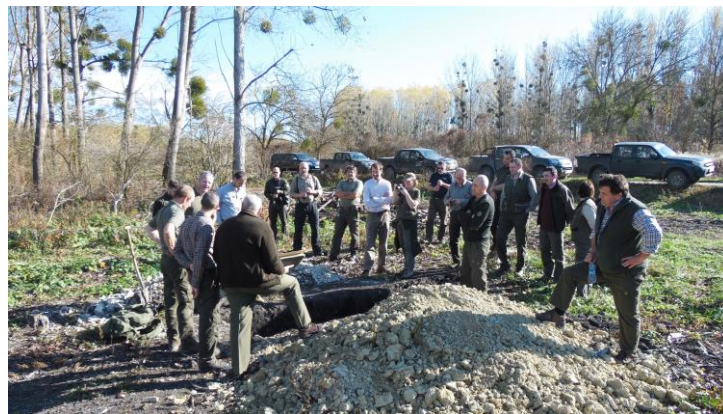
Talajtanos szakmai nap

2015. november 12.: Talajtanos szakmai nap a Hanságban