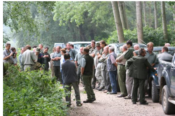
Szakmai nap a Szigetközben