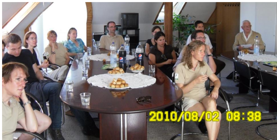
Bécsi vendégek Kapuváron

2010. Biosphärenpark Wienerwald csoportja Kapuvár környékén