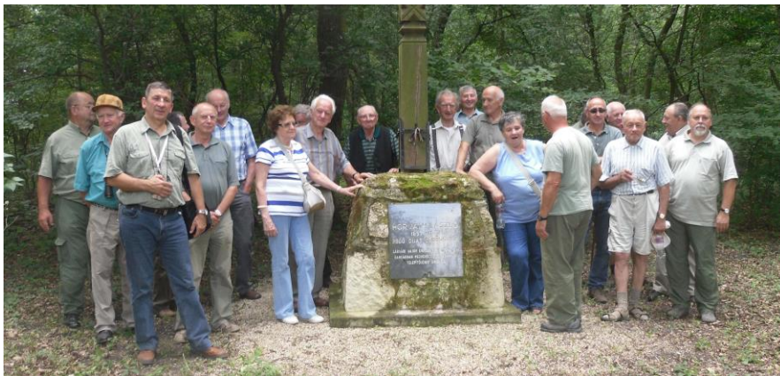
Nyugdíjas szakmai program

2012. június 29.: Nyugdíjas tagjaink tanulmányútja a Jánossomorjai Erdészetnél