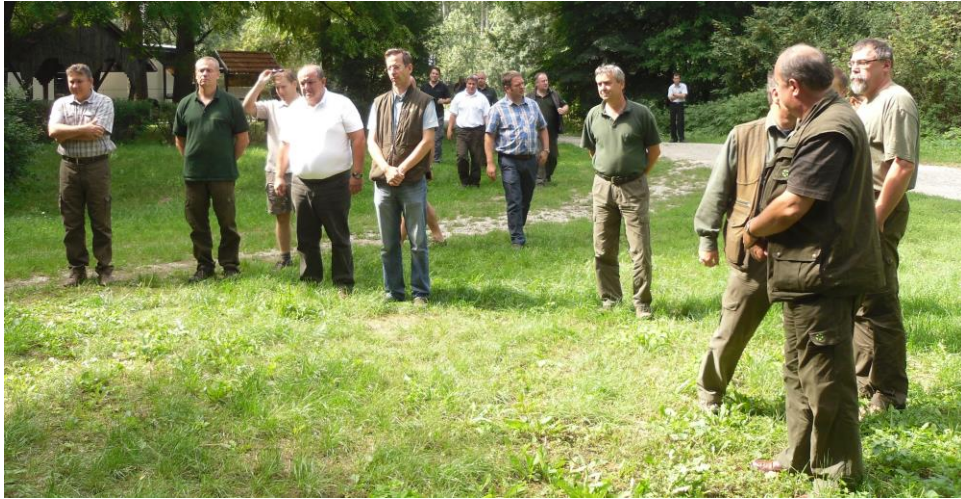
Pilisi kollégák a Hanságban

2014. Sajtókirándulás a Sokorói-dombságon és a Szigetközben, karintiai erdészek a Sokorói-dombságon és a Szigetközben